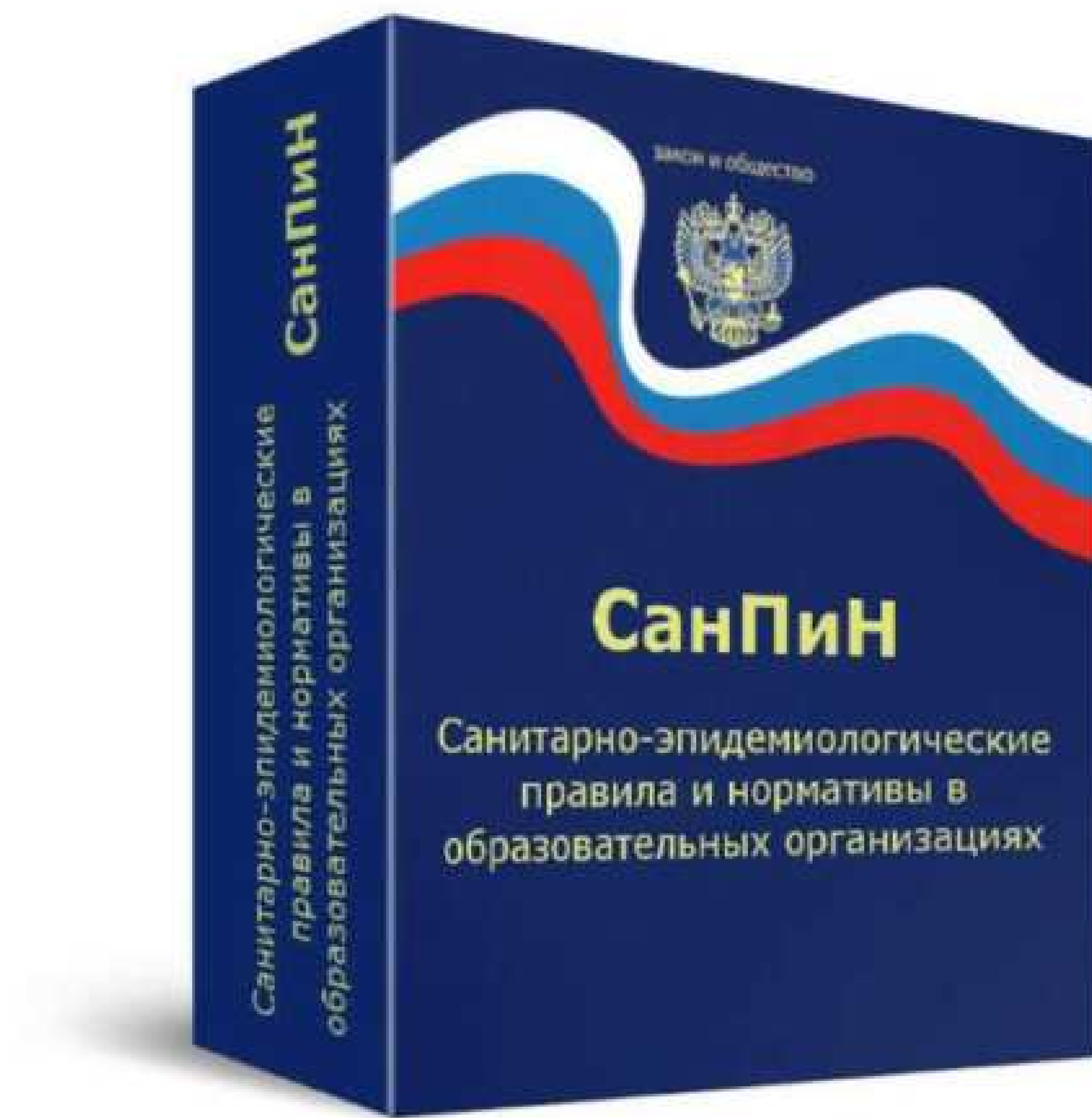
Санитарно-эпидемиологические правила и нормативы СанПиН 2.4.2.2821-10 утратили свою силу с 1 января 2021 года

Обращаем внимание на то, что при любой температуре образовательная организация обязана организовать учебный процесс для любого количества обучающихся, в частности правовых оснований отмены учебных занятий из-за сильных морозов в настоящее время не имеется.